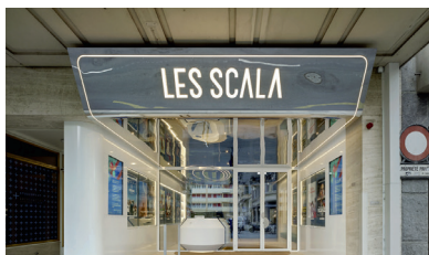
LES SCALA 23, rue des Eaux-Vives 1207 Genève www.les-scala.ch