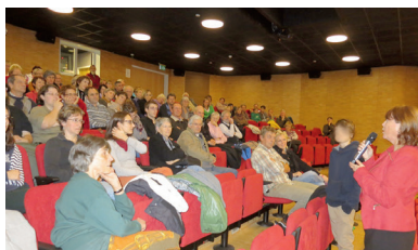
Ciné Versoix Aula du CO des Colombières 4, ch. des Colombières 1290 Versoix www.cineversoix.ch