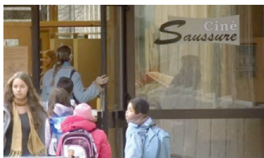
CINÉ SAUSSURE Aula du collège de Saussure 9, Vieux-Chemin d'Onex 1213 Petit-Lancy https://culture-rencontre.ch/cinesaussure/

Prochaine programmation : Septembre - Décembre 2025. La Maison de quartier des Eaux-Vives ( https://mqev.ch ) gère CinéPrim's aux Scala.