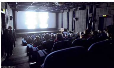
LES CINÉMAS DU GRÜTLI 16, rue du Général-Dufour 1204 Genève www.cinemas-du-grutli.ch